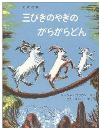
マーシャ・ブラウニ・絵 瀬田 貞二・訳

ノルウェーの昔話で1965年に翻訳出版され た絵本です。年を重ねても大切にされてきた絵本 です。これからも語り継いでいきたいですね。